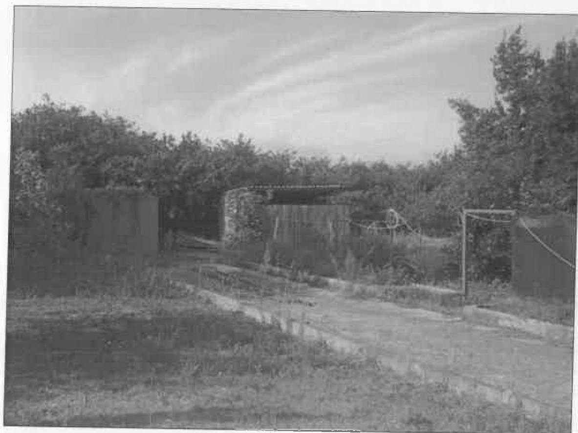
FOTO 29 - VISTA DEL GIARDINO (PARTICELLE 539-522) RIMESSE ATTREZZI LATO SUD