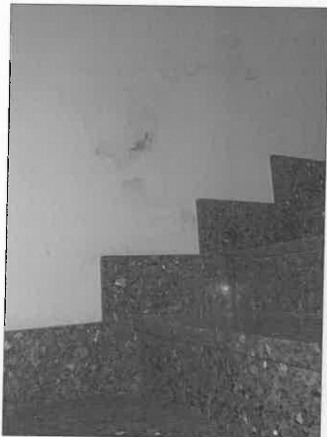
FOTO 35 - PARTICOLARE MACCHIE