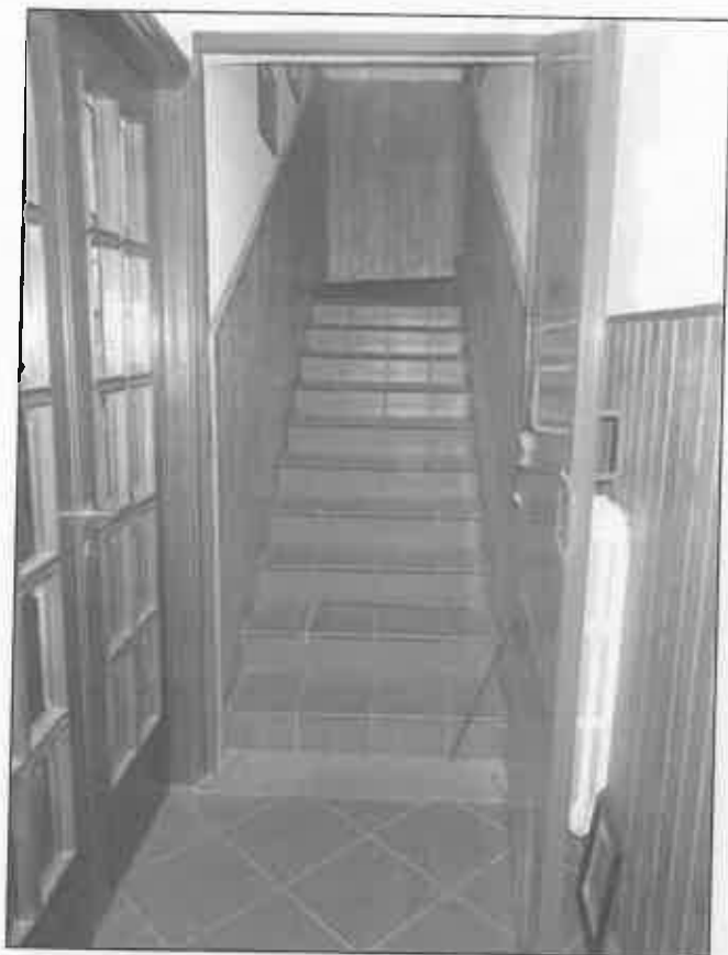
FOTO 58 - VANO SCALA PS1-PT