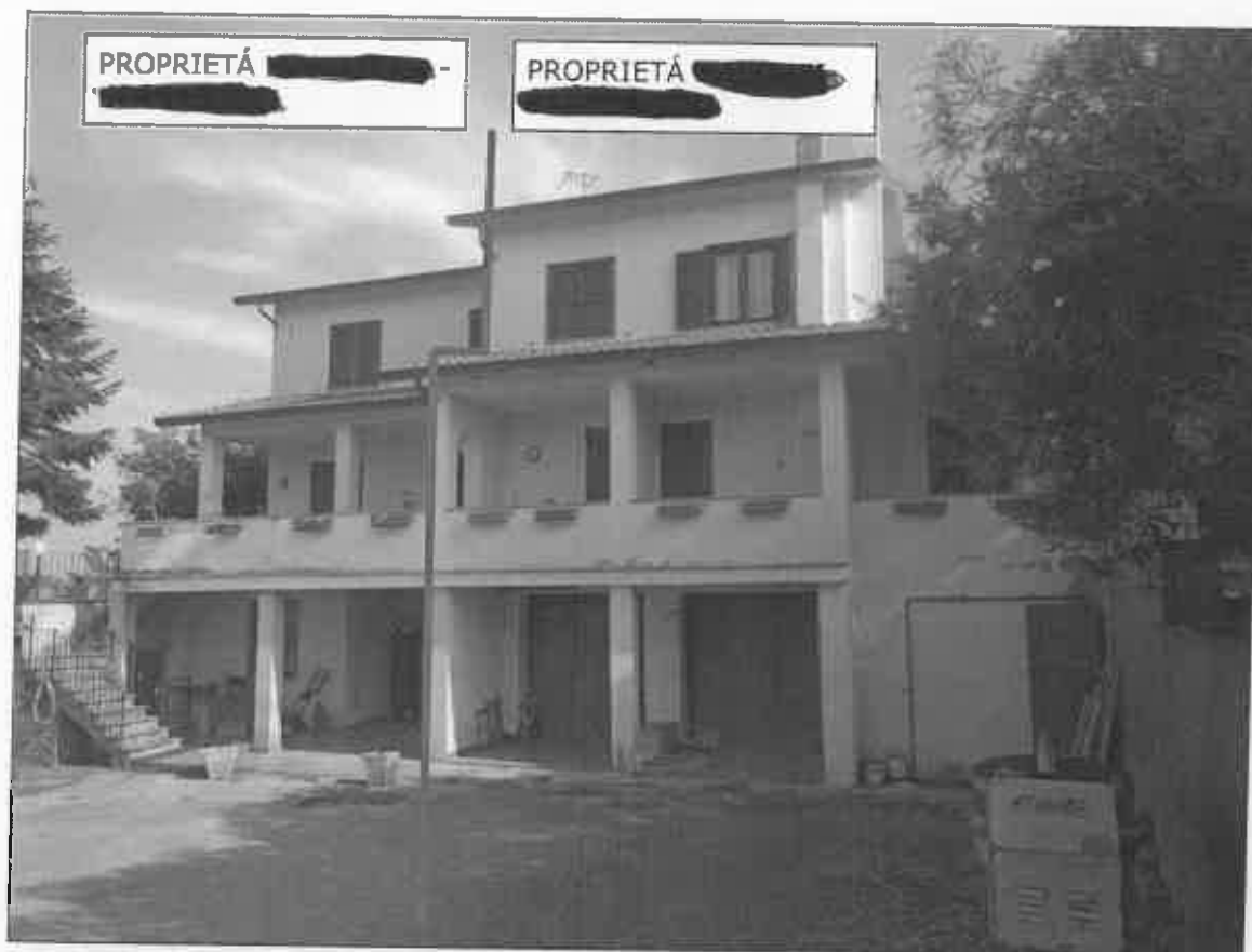
FOTO 21 - PROSPETTO SUD VILLA BIFAMILIARE