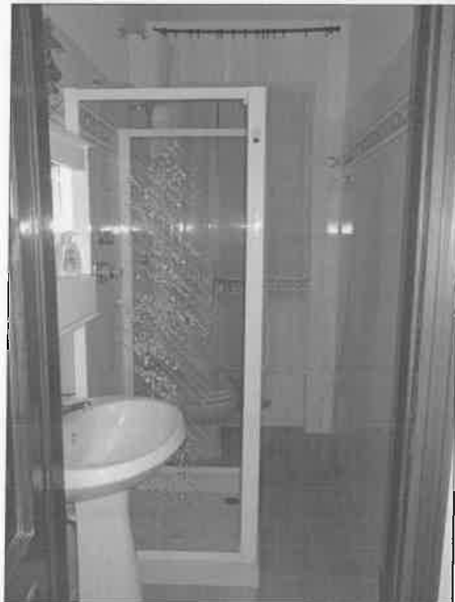
FOTO 52 - BAGNO PT