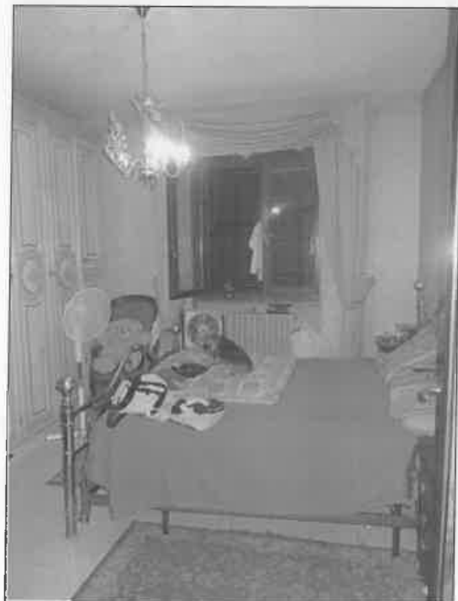
FOTO 41 - CAMERA LETTO P1