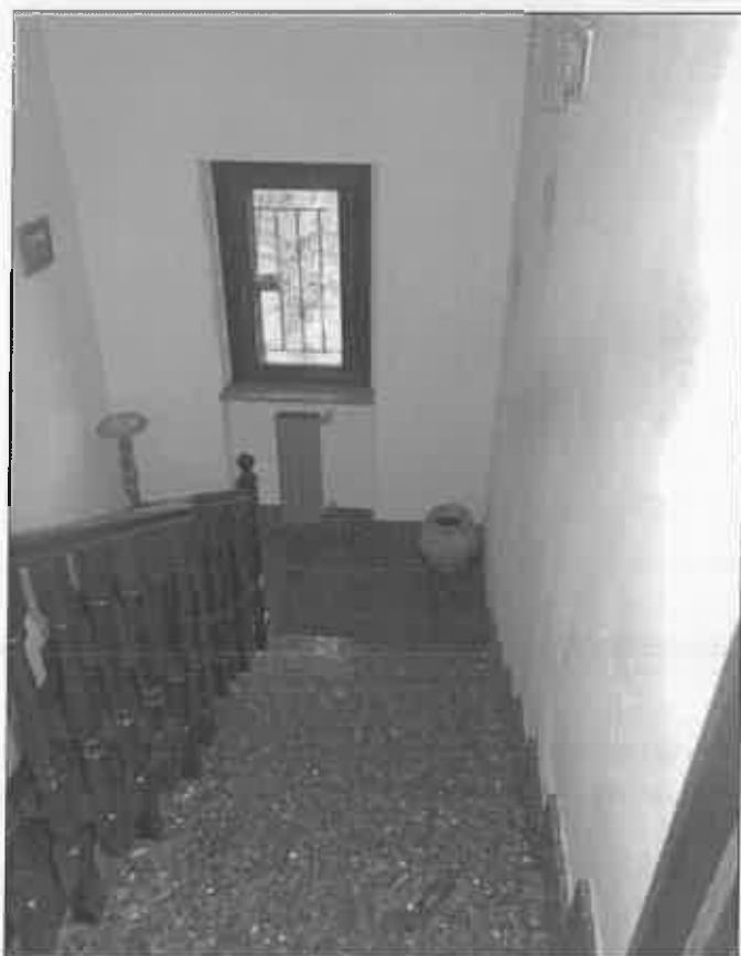
FOTO 33 - VANO SCALA PT-P1