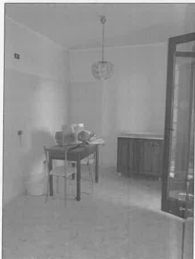
FOTO 49 - SOGGIORNO PRANZO PT