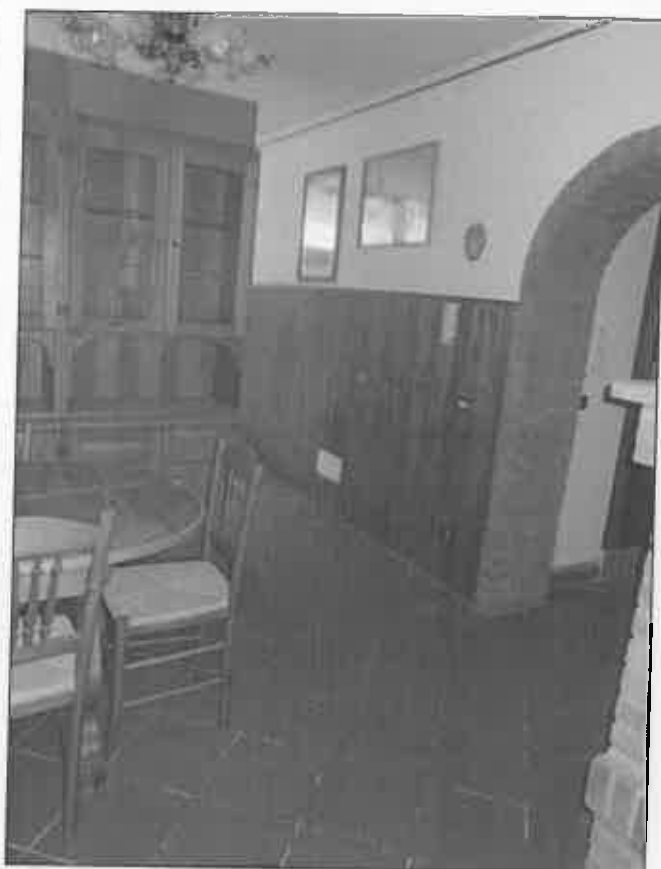
FOTO 59 - TAVERNA PS1