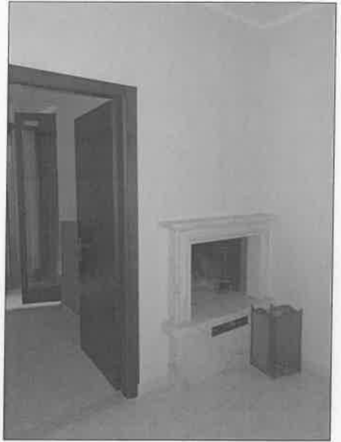
FOTO 50-51 - CAMERA LETTO PT CON ACCESSO DALLA LOGGIA