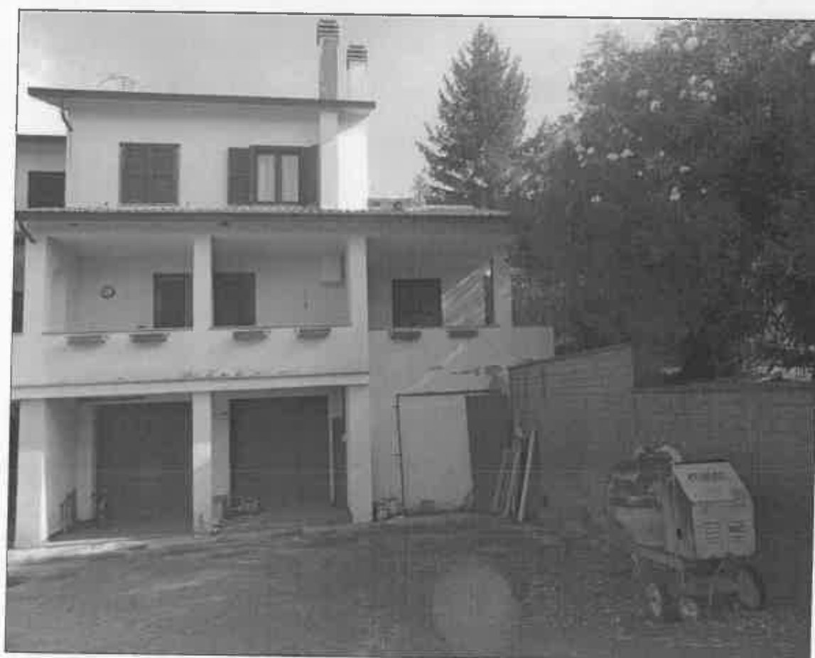
FOTO 22 - PROSPETTO SUD PROPRIETÀ ESECUTATI