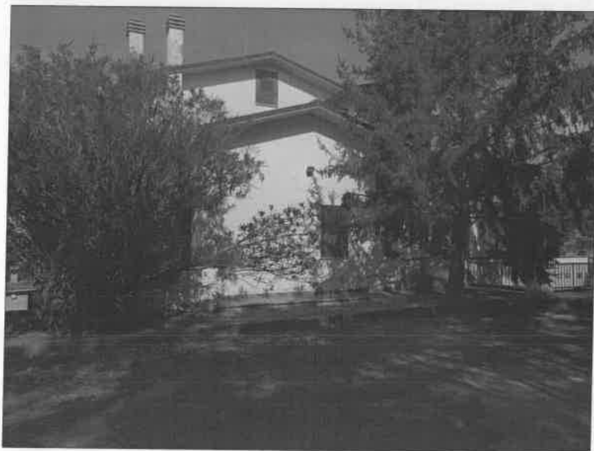
FOTO 20 - PROSPETTO LATERALE EST