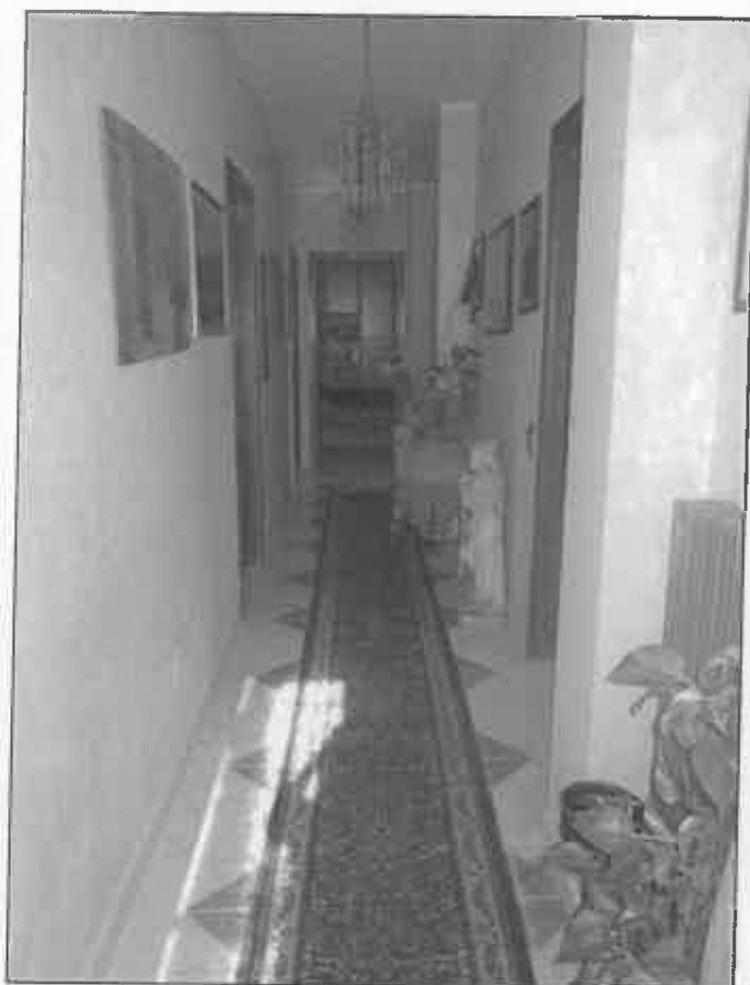
FOTO 36 - CORRIDOIO P1