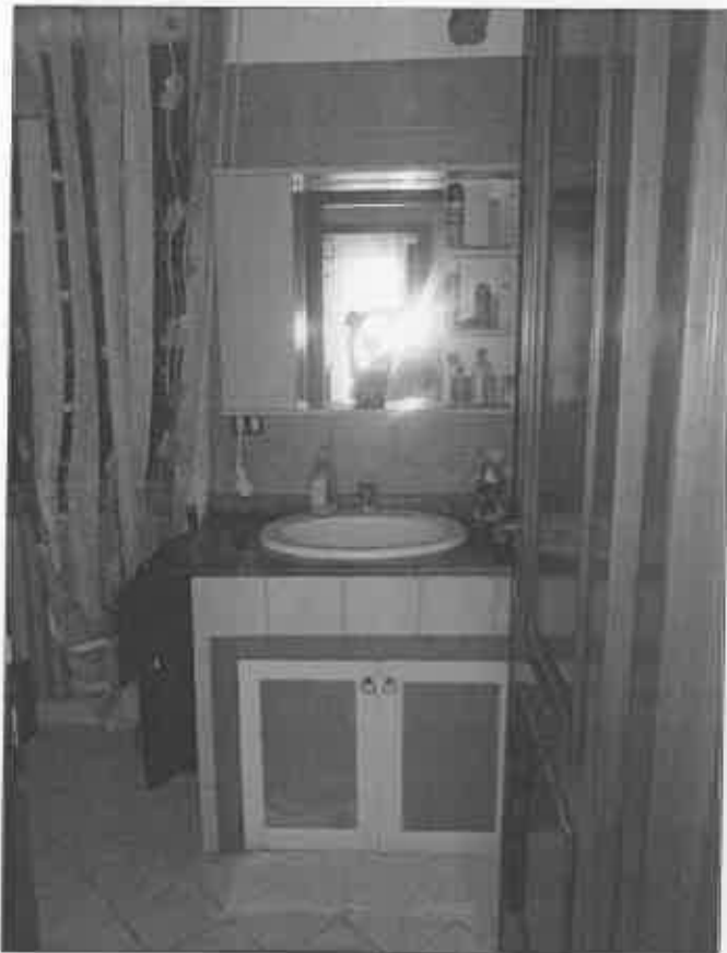
FOTO 39-40 - BAGNO P1