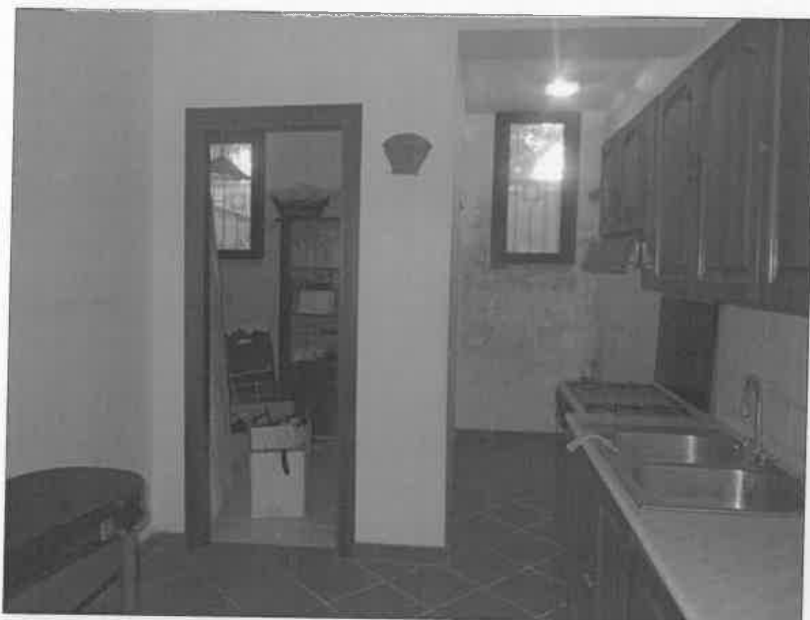
FOTO 63 - CUCINA PS1 CON VISTA SU BAGNO-RIPOSTIGLIO