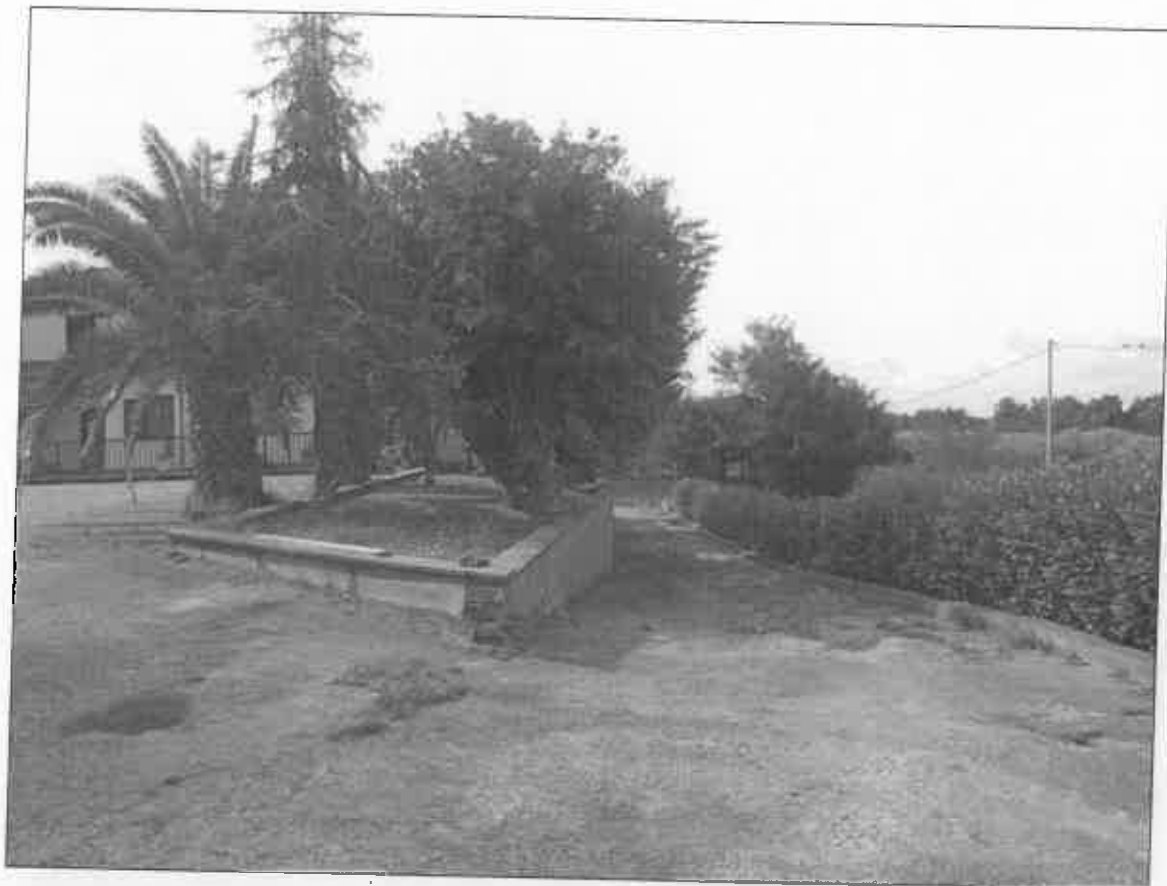
FOTO 17 - VISTA DEL PIAZZALE ANTISTANTE LA VILLA