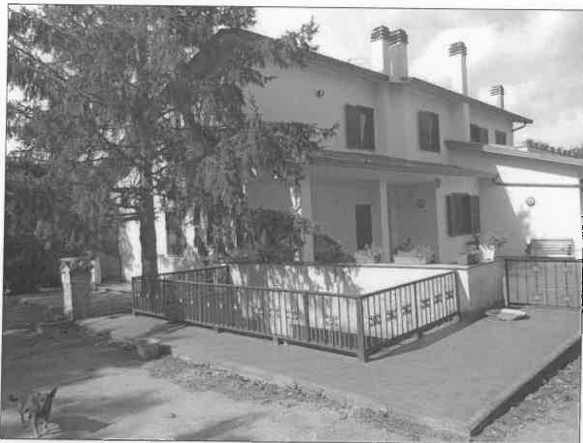
FOTO 19 - PROSPETTO NORD- EST