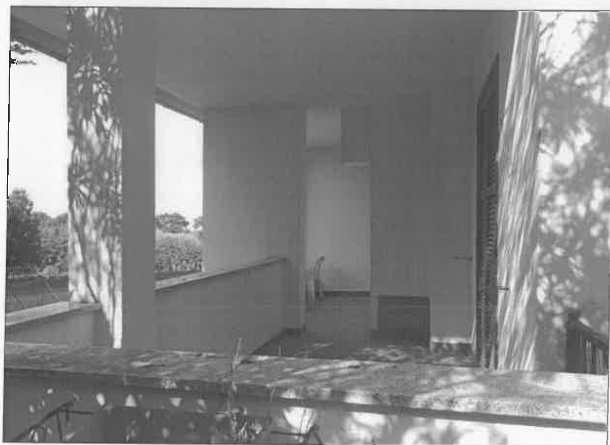
FOTO 25 - VISTA DELLA LOGGIA CON ACCESSO AL SOGGIORNO-PRANZO