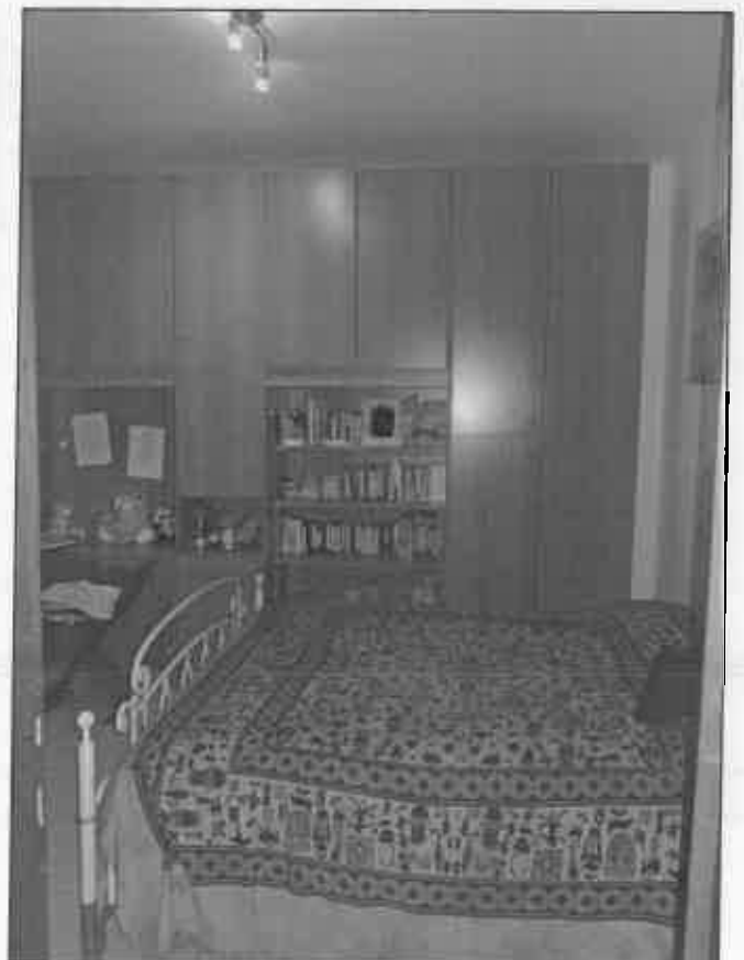
FOTO 42 - CAMERA LETTO P1