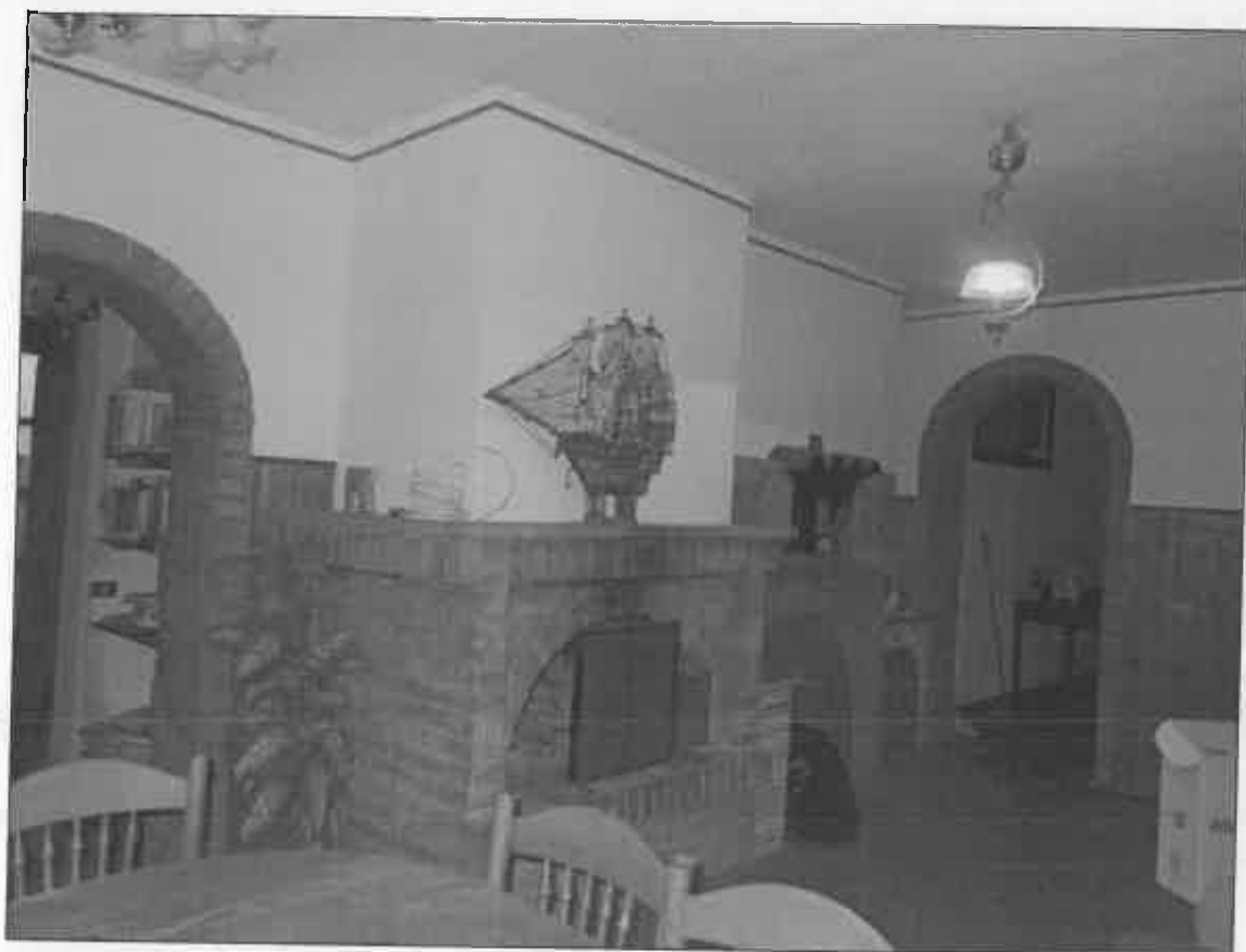
FOTO 60 - TAVERNA PS1