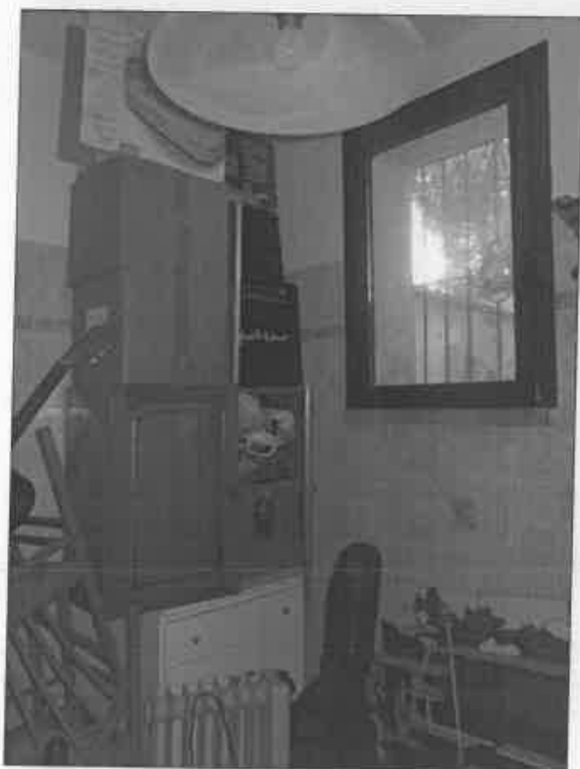
FOTO 64 - BAGNO-RIPOSTIGLIO PS1