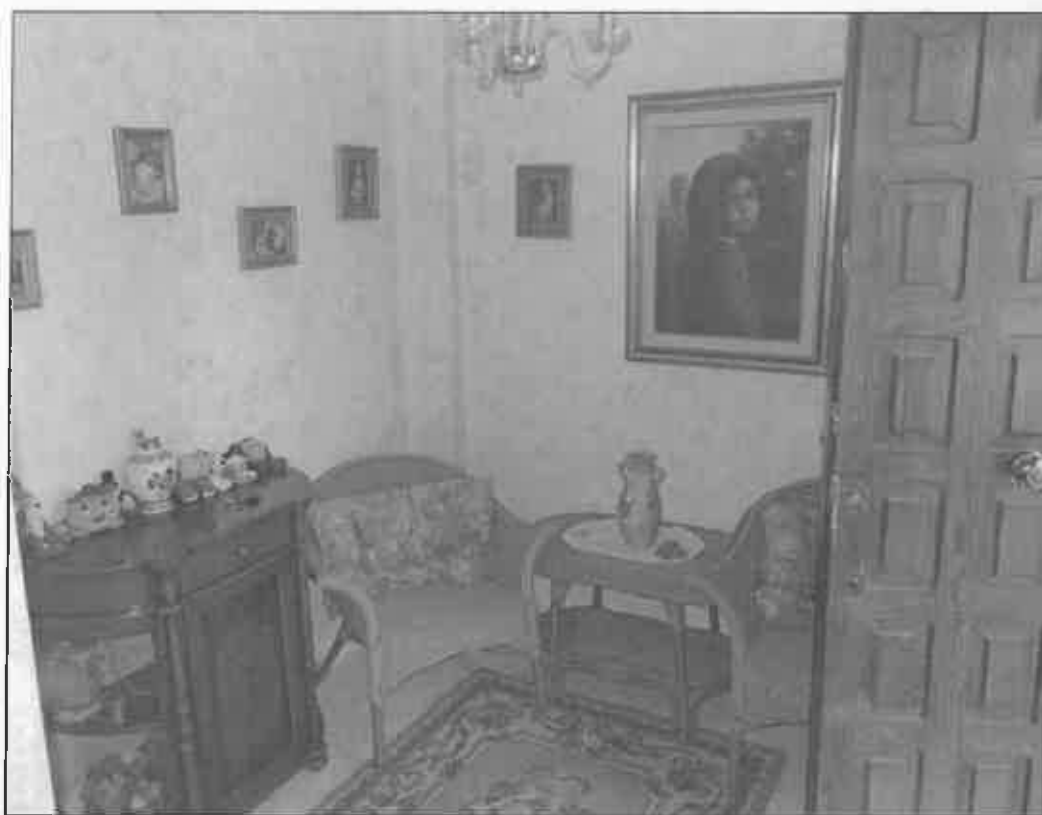
FOTO 32 - INGRESSO PT