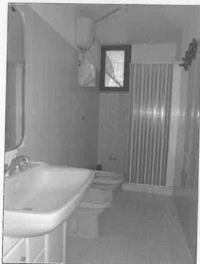
FOTO 55 - BAGNO PS1