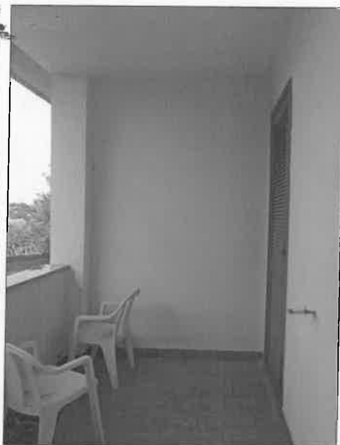
FOTO 24 - VISTA ACCESSO ALLA CAMERA DALLA LOGGIA