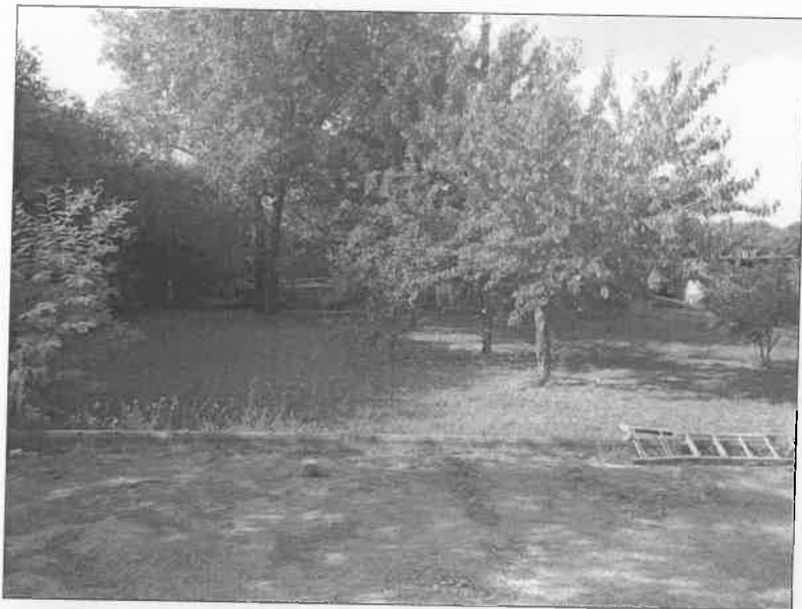
FOTO 28 - VISTA DEL GIARDINO (PARTICELLE INDIVISE 539-522) LATO SUD