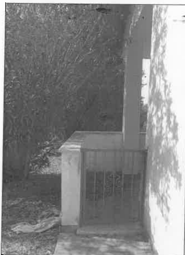
FOTO 23 - INGRESSO LOGGIA