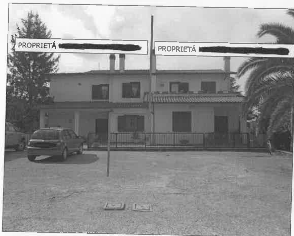
FOTO 18 - PROSPETTO NORD DELLA VILLA BIFAMILIARE