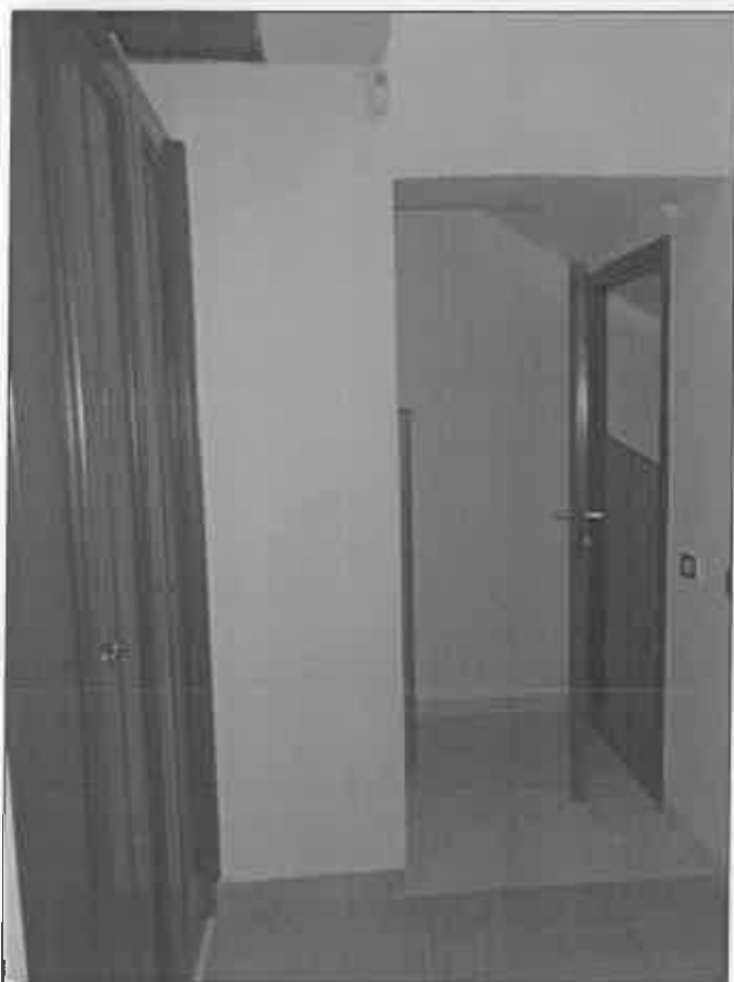
FOTO 48 - DISIMPEGNO PT