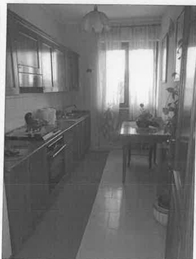
FOTO 38 - CUCINA P1