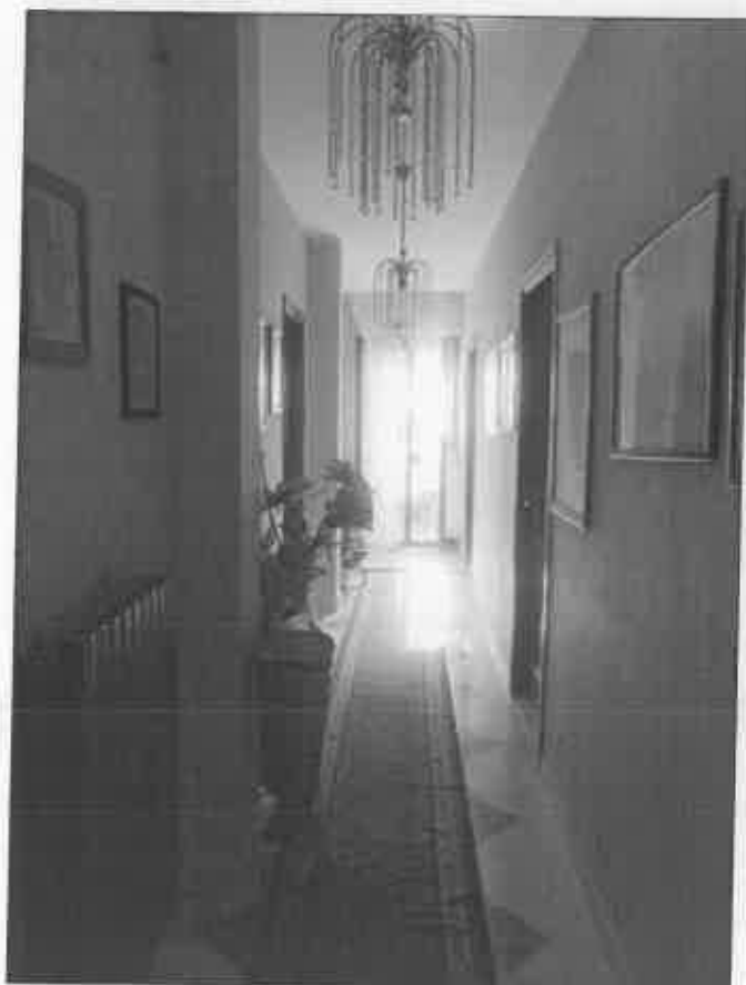
FOTO 37 - ACCESSO TERRAZZA CORRIDOIO P1